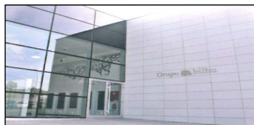
Figura 4. Fachada de cerámica fotocatalítica del Grupo Bilbu en Bilbao.

Existen experiencias en Madrid, Barcelona, Bilbao y Castellón de la aplicación de fachadas fotocatalíticas. Se han realizado ensayos a escala real realizados por el CEAM, que han obtenido resultados que sugieren que 1 m 2 , expuesto al sol, llega a descontaminar cerca de 270,91 microgramos de NOx por hora.