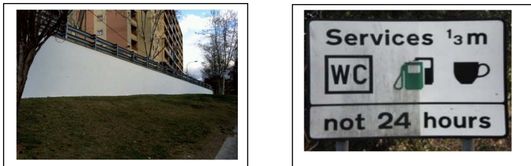
Figura 6. Derecha: Detalle de señal con tratamiento fotocatalítico incoloro y sin tratamiento donde se aprecia el efecto autolimpiante (Fuente: Active Walls). Izquierda: Muro de Fabra i Puig (Barcelona) Fuente: Ayto. Barcelona.

Uno de los ejemplos más destacados sería el muro de Fabra i Puig de Barcelona, que se llevó a cabo hace más de 3 años y su aspecto es similar al de una obra recién terminada. También existen aplicaciones sobre fachadas de edificios a nivel de pinturas de exterior, pinturas de interiores en restaurantes, cuartos de basura, aparcamientos, etc, que ponen de manifiesto la capacidad autolimpiante, reduciendo los costes de conservación y mantenimiento.