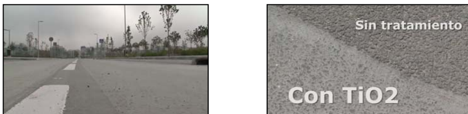
Figura 3. Izquierda: pavimentos fotocatalíticos en el Eco-barrio de la Rosilla (Madrid). Derecha: Detalle de aspecto de pavimento fotocatalítico con respecto a un pavimento convencional sin tratar.

Existen numerosas aplicaciones de pavimentos fotocatalíticos, tanto a nivel de tráfico rodado, como peatonal en Madrid y Barcelona, que permiten reducir hasta un 30% de concentraciones de NOx, según el ensayo ISO 127197-1. Tal es el caso de la Calle Martín de Los Heros, General Pardiñas, San Bernardo, Lope de Haro, Av Betanzos o Hermanos García Noblejas, por citar algunos ejemplos en Madrid. Y entornos del Mercado de Sants, Ciudad Meridiana, Calle Rauric, Plaza dels Horts de San Pau o Av. Diagonal, en el caso de Barcelona.